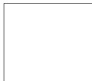
Other finishes, see price list