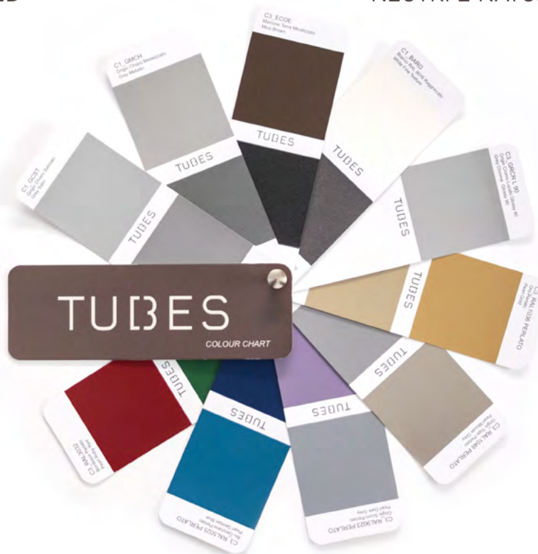
METALLIZZATI E MICALIZZATI - METALLIC AND MICA