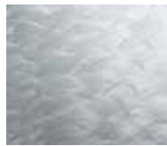
Feather finish stainless steel