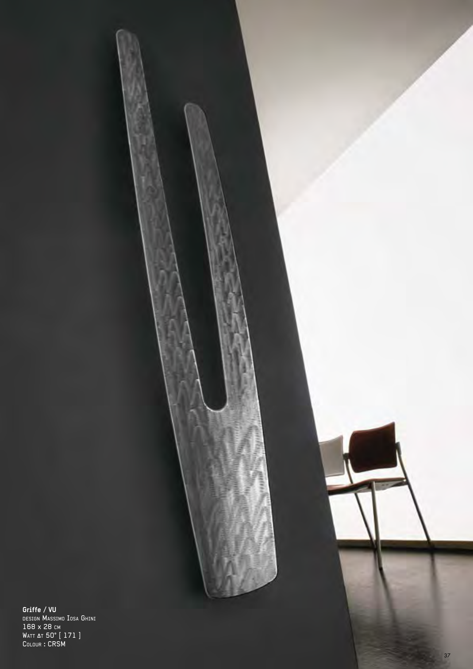
Griffe / VU DESIGN MASSIMO IOSA GHINI 168 x 28 CM WATT ΔT 50° [ 171 ] COLOUR : CRSM