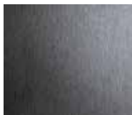
Satin black stainless steel