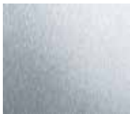
Ground stainless steel