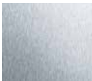
Ground stainless steel