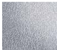
Skin finish stainless steel