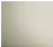
Powder-coated (see Runtal colour chart)