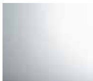
Mirror-polished stainless steel