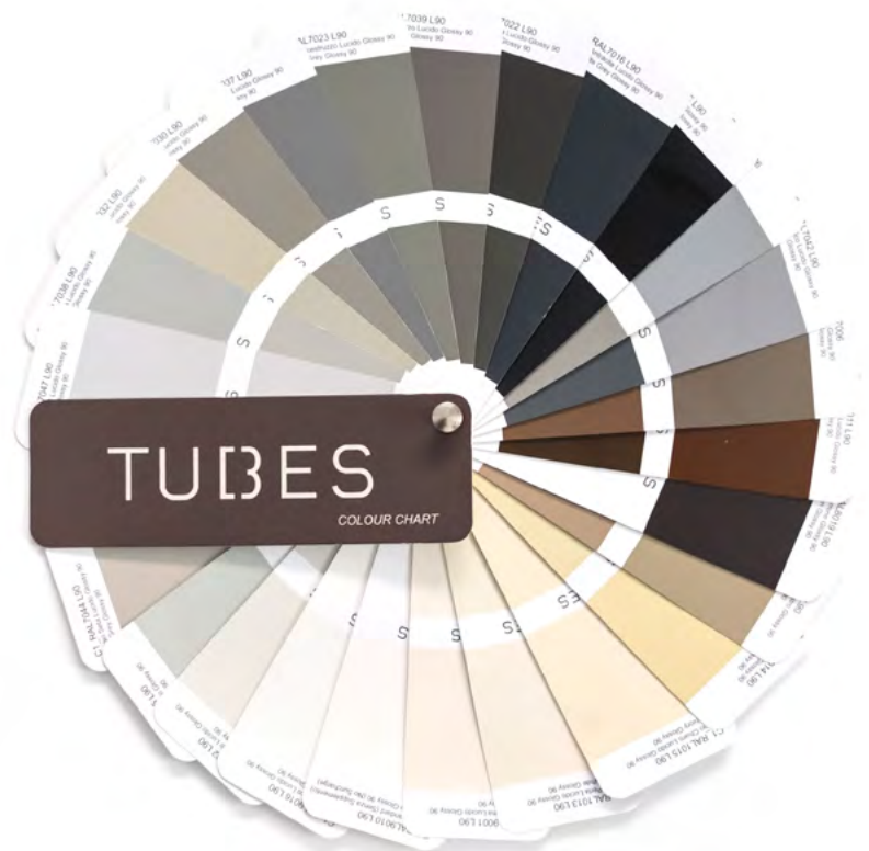
NEUTRI E NATURALI - NEUTRALS AND NATURALS