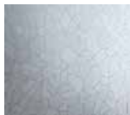
Patch finish stainless steel