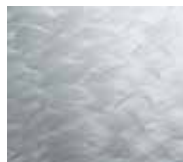
Feather finish stainless steel