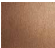
Satin bronze stainless steel