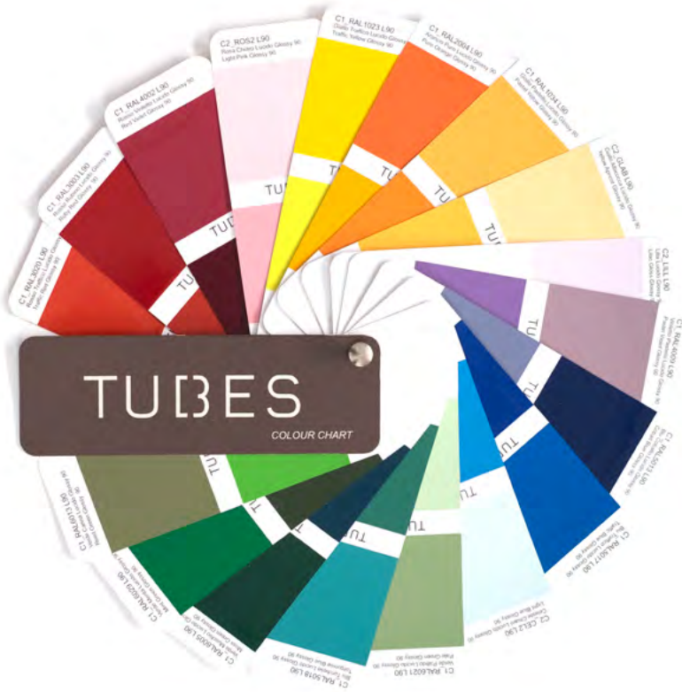
COLORATI - COLOURED

CLICCA SUL COLORE PER VISUALIZZARE LA SCHEDE CLICK ON THE COLOUR TO VISUALIZE THE CHART